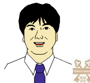
リフォームコンシェルジュ