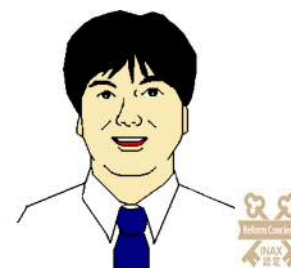
リフォームコンシェルジュ