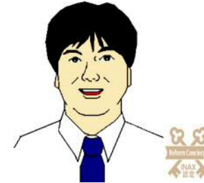
リフォームコンシェルジュ

4月は本来なら、新学期、新社会人など多くの方がスタートする月です。しかし今年も、新型コロナウイルスの感染防止の対策の為、卒業式、入学式、入社式、主だったスポーツイベント やコンサートなどが中止になり、社会に大きな影を落としました。私たちの仕事も会議等の自粛は勿論、商品の入荷が大幅に遅れるなど大きな影響が出ました。一日も早く、新型コロナウイルスが終焉を迎えることを心より願います。